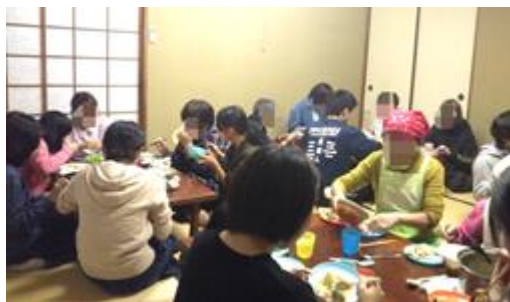
(子ども食堂の様子)