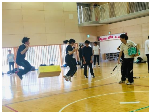
(レクリエーションリハーサルの様子) ※少年たちは写っていません

施設職員の方々によると、同職員以外との関わりが少ない少年たちは、ボランティアの訪問を楽しみにしており、とりわけ年代が近く大学生が多いBBSのような団体の会員の話を聞いたり、一緒に体を動かしたりすることは、いい刺激になっている、また、中には、大学に興味を持ったり、いろいろな職業を知り将来の夢が広がったりする少年もいるとのこと。レクリエーションの楽しみだけでなく、BBSとの関わりを通して、少年たちが自分を見つめ直すいい機会になればと願っています。